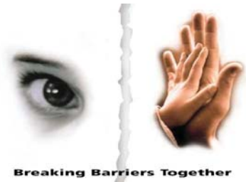
Breaking Barriers Together

A fogyatékkal élők helyzete a kibővült Európai Unióban: Európai Akcióterv 2006 című jelentés kapcsán plenáris felszólalásomban hangsúlyoztam: a fogyatékkal élők helyzete ma Európában rendkívül nehéz, sajnos többszörös diszkriminációval kell szembenéznük. A legtöbb helyen még a mozgásukhoz alapvetően fontos, akadálymentes közlekedésük sem megoldott, nemhogy társadalmi beilleszkedésük. Fontos, hogy tudatosuljon: az önálló élet nemcsak azt jelenti, hogy valaki egyszerűen a társadalom tagja, hanem azt is, hogy ő is ugyanolyan tagja a társadalomnak, mint bárki más, azaz teljes jogú részvétele biztosított a társadalmi élet összes területén. Erre figyelmet kell fordítania valamennyi politikaformálónak és döntéshozónak.