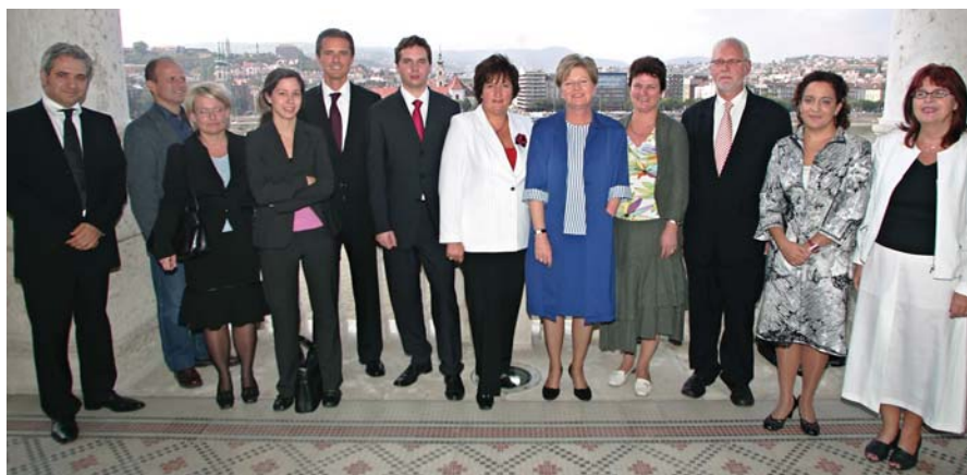
A Delegáció tagjai Dr. Szili Katalinnal, a Parlament elnökével és a magyar EP képviselőkkel