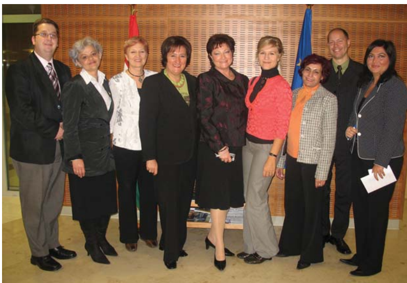
Dr. Gurmai Zita a tanulmányút résztvevőivel

A z Esélyegyenlőség európai éve előtt ez az út nagyban hozzá járult ahhoz, hogy az európai üzenetek, eszmék Magyarországon is teret nyerjenek, és ki tudjuk használni a különleges évben rejlő lehetőségeket.