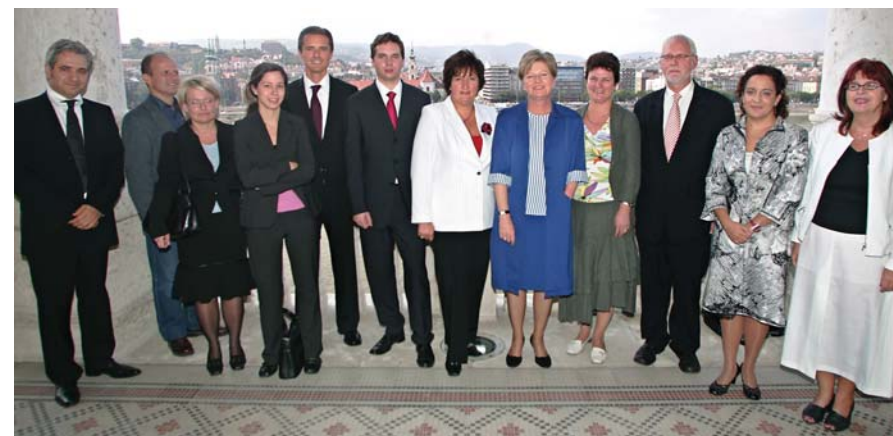
A Delegáció tagjai Dr. Szili Katalinnal, a Parlament elnökével és a magyar EP képviselőkkel

ról, hogy Magyarország intézményrendszere az uniós pénzek felhasználására felkészült és magasan az uniós szint felett van.