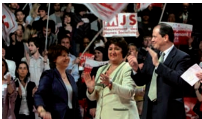
Az európai választási kampány megnyitóján Toulouse-ban