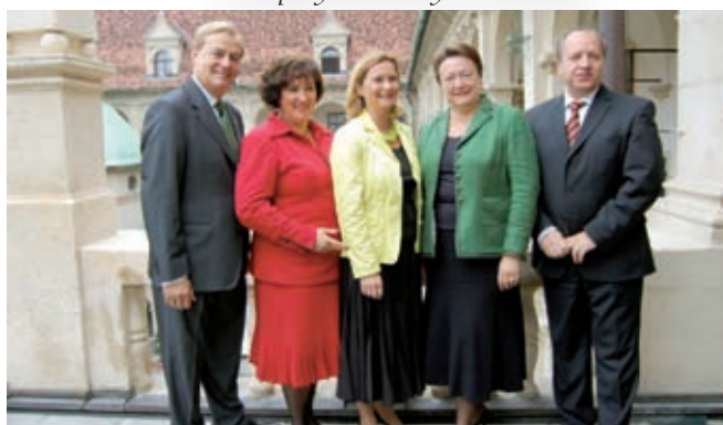
Kultúra határok nélkül, Grazban Kórozs Lajos államtitkár úrral