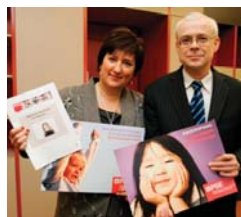
Vladimir Špidlával a gyermekérett kampány zárórendezvényén

A 2008-as év első plenáris ülésén, január 15-én, Roberta Angelilli Az EU gyermejjogi stratégiája felé című jelentéséhez hozzászólva elmondtam, hogy Európa sorsát jelentősen befolyásolja, hogy képes-e gyermekeket befogadó és támogató társadalmak kialakítására. Az Európai Unió jövője szempontjából szerintem meghatározó jelentőségű a gyermekek jogainak támogatása és védelme. A gyermekbarát társadalmak kialakítása az Unióban nem választható el az európai integráció további elmélyítésétől és megszilárdításától. Átfogó EU-stratégiára van szükség, amely hatékonyan elősegíti és biztosítja a gyermekek jogainak érvényesülését az Unión belül és kívül is. A gyermekeket megilleti a különleges gondoskodás és megfelelő jogi védelem.