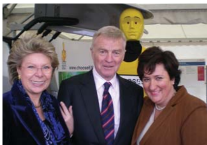
Viviane Redinggel és Max Mosleyval az ESC bemutatón

Az i2010 nevű új közösségi program stratégiai és politikai keretet ad az európai gazdasági növekedés fejlesztésére kihasználva az információs és kommunikációs