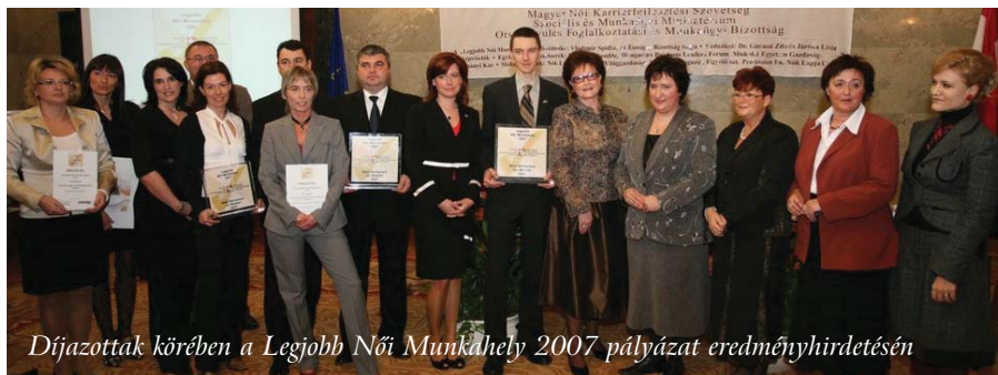
Díjazottak körében a Legjobb Női Munkahely 2007 pályázat eredményhirdetésén

A fenti szempontok alapján az első díjat a dm Kft. nyerte. Második helyezett a Paksi Atomerőmű, harmadik pedig a GE Hungary Zrt. Healthcare Division lett. A Szociális és Munkaügyi Minisztérium különdíjat adományozott a WEST Hungary Consulting Kft. részére, amely egyedül indult a közép- és nagyvállalati kategóriában. A Nők Lapja különdíját a Budapest Banknak, a Világgazdaság különdíját a Pannon GSM-nek ítélte oda. A rendezvény fővédnöke Vladimir Spidla foglalkoztatásért, szociális ügyekért és esélyegyenlőségért felelős európai biztos, védnökei Járóka Livia európai parlamenti képviselő és jómagam voltunk.