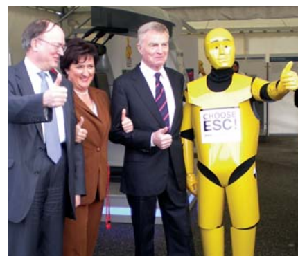
Mi az ESC-t választottuk

lyoztam. Fel kell hívnunk a fogyasztók, kereskedők és a döntéshozók figyelmét az információs és kommunikációs technikán alapuló megoldások lehetséges előnyeire. A tájékoztatásnak tömörnek, érthetőnek és világosnak kell lennie. A lehető legnagyobb közönséget kell elérnünk vele, különösen igaz ez az autókerekeskedőkre és az ott dolgozóakra. Ebben a folyamatban a televízió és az internet szerepe óriási. Nem szabad azonban elfelejtenünk, hogy az európai autópiacon nagyon töredezett, egyenetlen. A tájékoztatás azokban az országokban a legfontosabb, ahol az intelligens rendszerek még csak szűk körben érhetőek el, azonban a balesetek száma kiemelkedően magas. Végül, de nem utolsósorban kiemelttem, hogy ezen berendezések megfizethetőnek kell lenniük, hiszen az önmagában nem elegendő, hogy életet menthessenek. Az a cél, hogy mindenki által hozzáférhetően valóban életet is mentsenek.